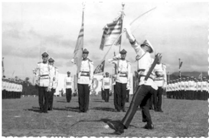
Chỉ làm trai tới bốn phương trời