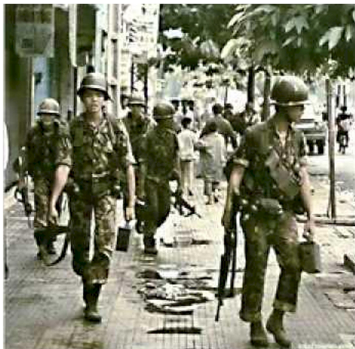
Lính Nhảy Dù trong những ngày cuối của Việt Nam Cộng Hòa