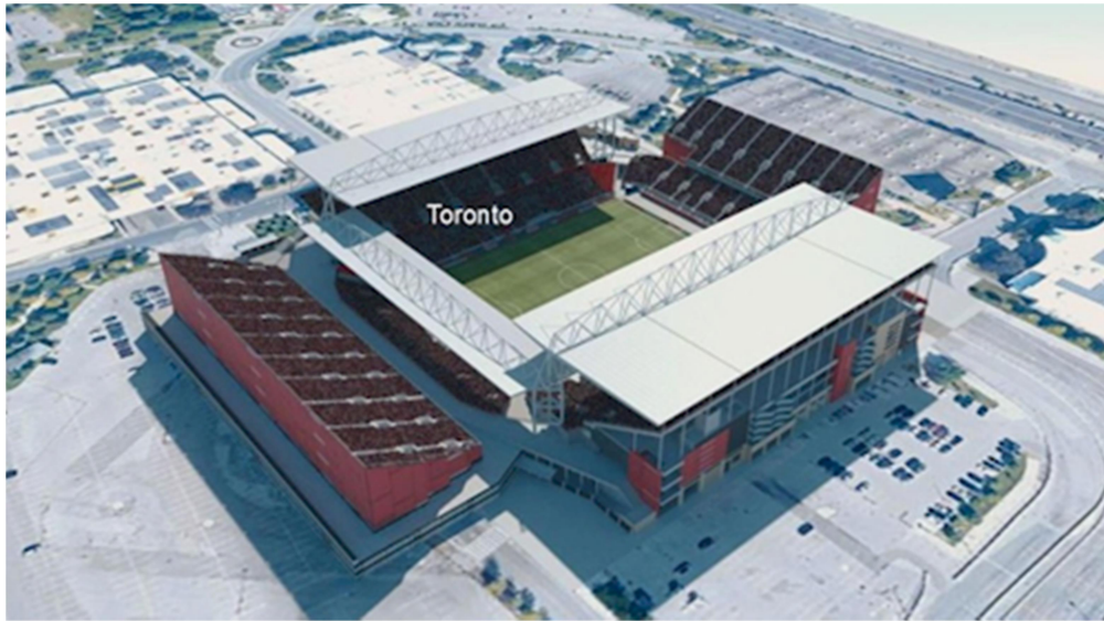
Sân này hoàn toàn mới có thể chứa 45 ngàn người.