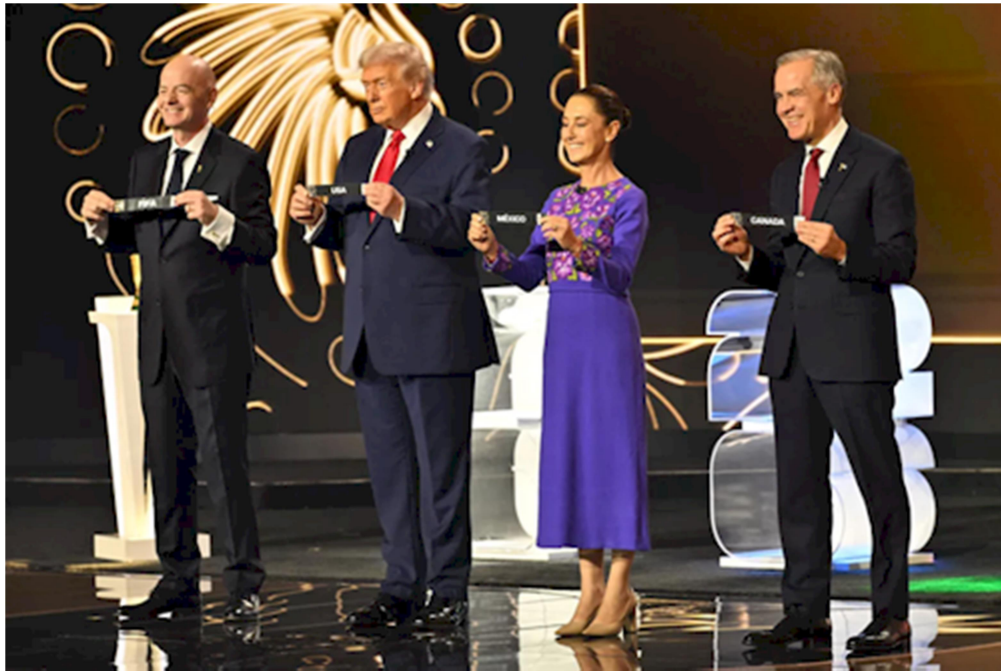
Hình 3 đại diện cho 3 quốc gia tổ chức chụp cùng với ông Infantino trong buổi lễ bốc thăm: Tổng thống Donald J. Trump (Mỹ), Bà Tổng thống Claudia Sheinbaum (Mê), và Thủ tướng Mark Carney (Canada).