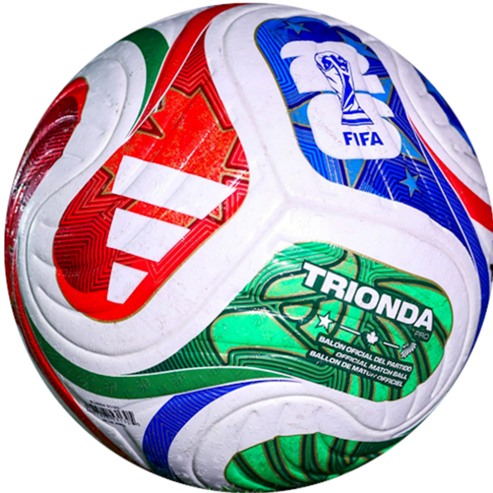
Hình trái banh Trionda được dùng trong giải kỳ này.