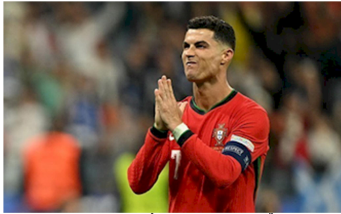
Ronaldo sẽ có mặt lần thứ 6 ở W.C.

World Cup 2026 cũng đánh dấu lần thứ 6 mà Ronaldo (Bồ Đào Nha), Lionel Messi (Á Căn Đình), và Guillermo Ochoa (Mễ) tham dự.