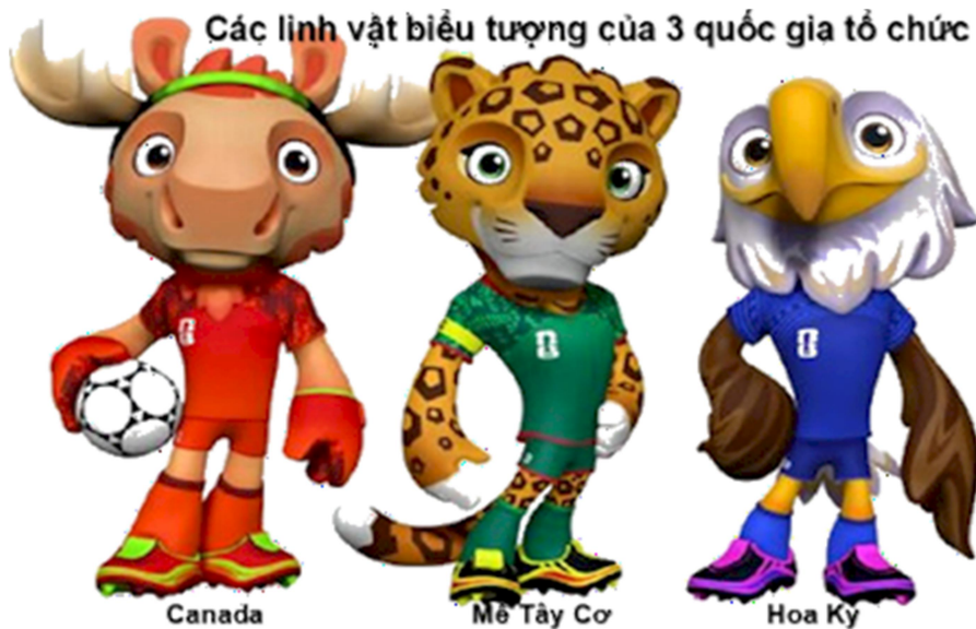
Hình 3 linh vật biểu tượng cho 3 quốc gia tổ chức: Ba linh vật được giới thiệu gồm: "Maple", chú nai sừng tấm Canada; "Zayu", báo đốm Mexico, và "Clutch", đại bàng đầu trắng của Mỹ. Bộ ba linh vật này tượng trưng cho tinh thần đoàn kết, sự đa dạng văn hóa, và niềm đam mê bóng tròn, đồng thời phản ánh đặc trưng của mỗi quốc gia tổ chức.