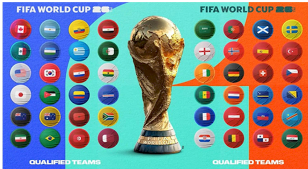
Hình màu cờ của 48 nước tham dự vòng chung kết.

Với thể thức mở rộng, 48 đội sẽ được chia thành 12 bảng, mỗi bảng gồm 4 đội.