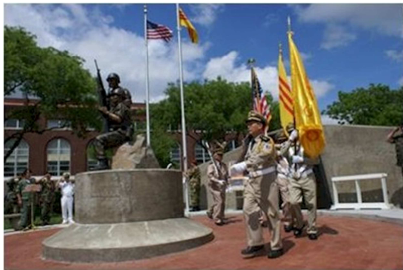
Tượng Đài Chiến Sĩ Việt-Mỹ, Wichita, Kansas