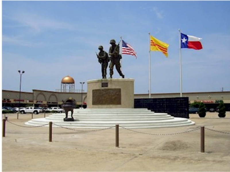
Tượng Đài Chiến Sĩ Việt-Mỹ, Bellaire, Houston