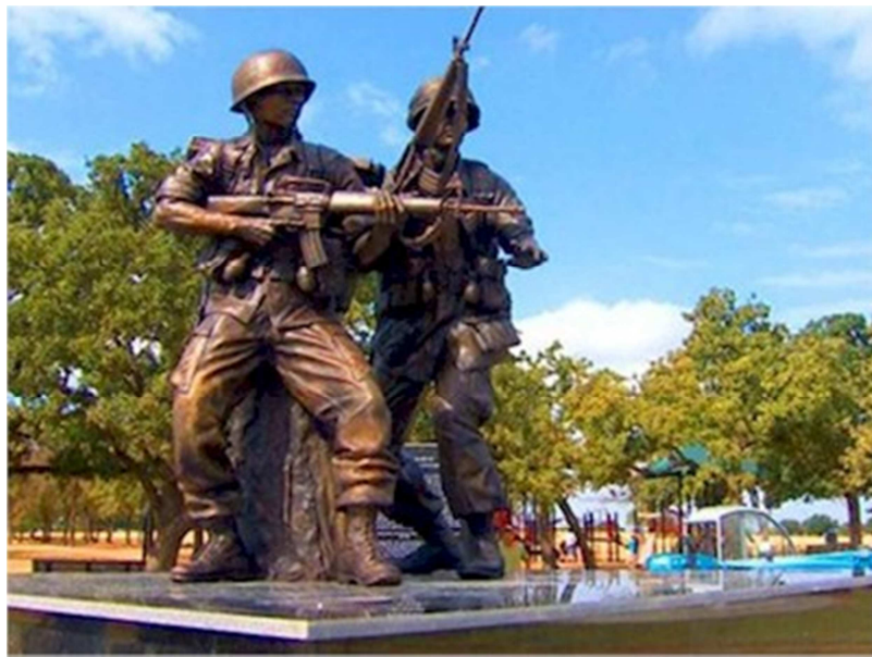
Tượng Đài Chiến Sĩ Việt-Mỹ tại công Veterans Park ở Arlington, Texas.