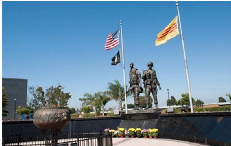
Tượng Đài Chiến Binh Hoa Kỳ và Việt Nam Cộng Hòa tại khu Little Saigon, thành phố Westminster Quận Orange, nam California, Hoa Kỳ.

Bài này Tôi đặc biệt viết về TƯỢNG ĐÀI CHIẾN SĨ VIỆT-MỸ tại Thị Xã Westminster, nam California-Hoa Kỳ, vì có thể đây là Tượng đài đầu tiên được xây dựng trên đất nước Hoa Kỳ và trên toàn Thế giới.