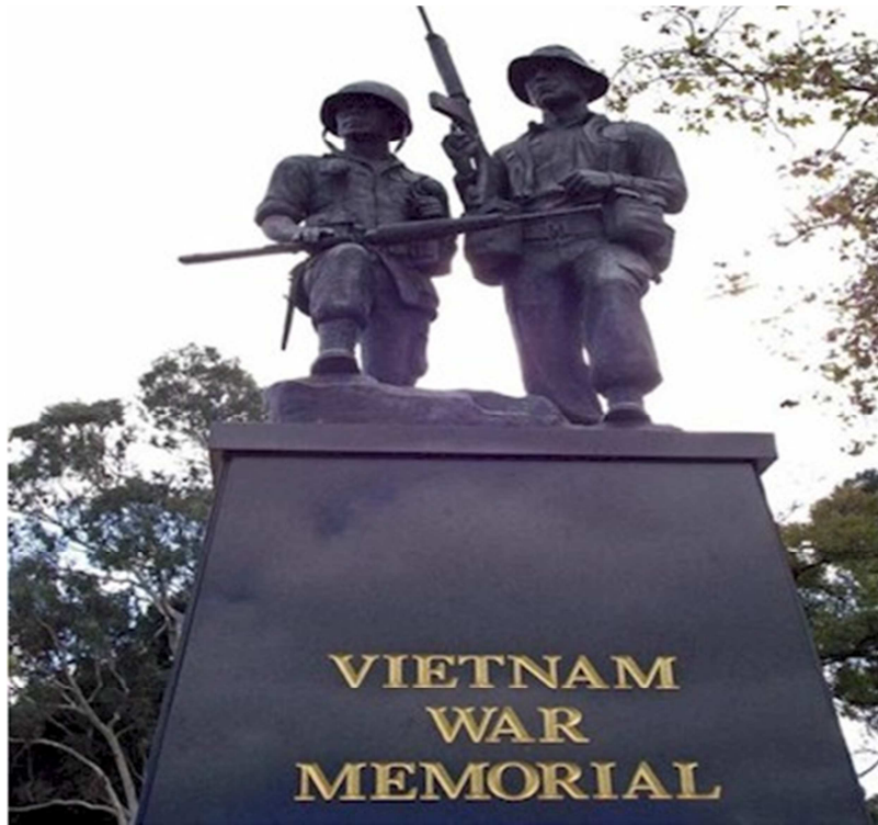
Tượng Đài Chiến Sĩ Úc-Việt, Aldelaide, Australia