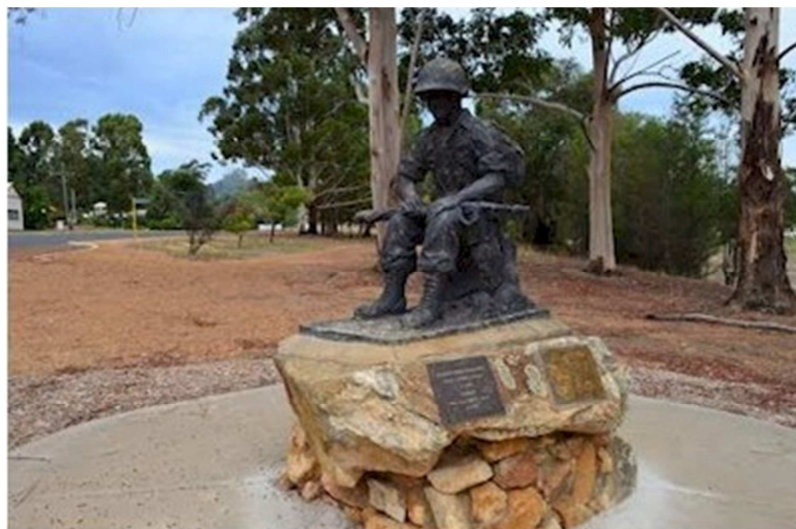
Đài Chiến Sĩ Việt Nam, Nannup, Australia