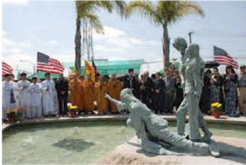
Lễ khánh thành tượng đài Tưởng Niệm Thuyền Nhân tại thị xã Westminster, Khu Little Saigon, Quận Orange, Nam California, Hoa Kỳ.

Tượng Đài Thuyền Nhân tại Bảo Tàng Viện Hàng Hải Oslo, Na-uy.