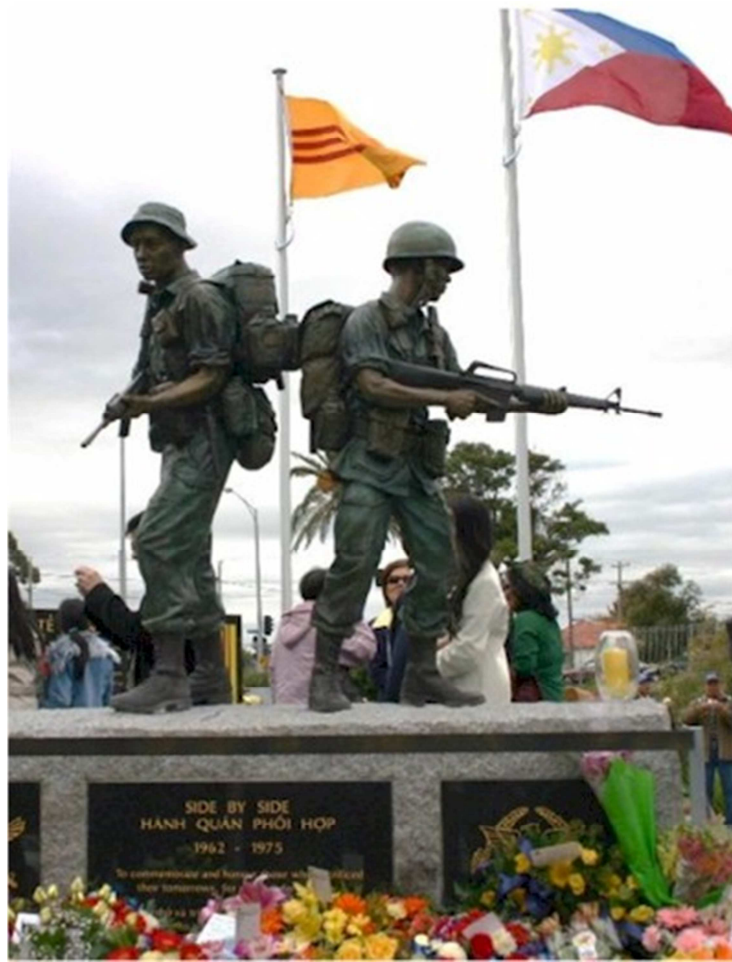
Trượng Đài Chiến Sĩ Úc-Việt, Victoria, Australia