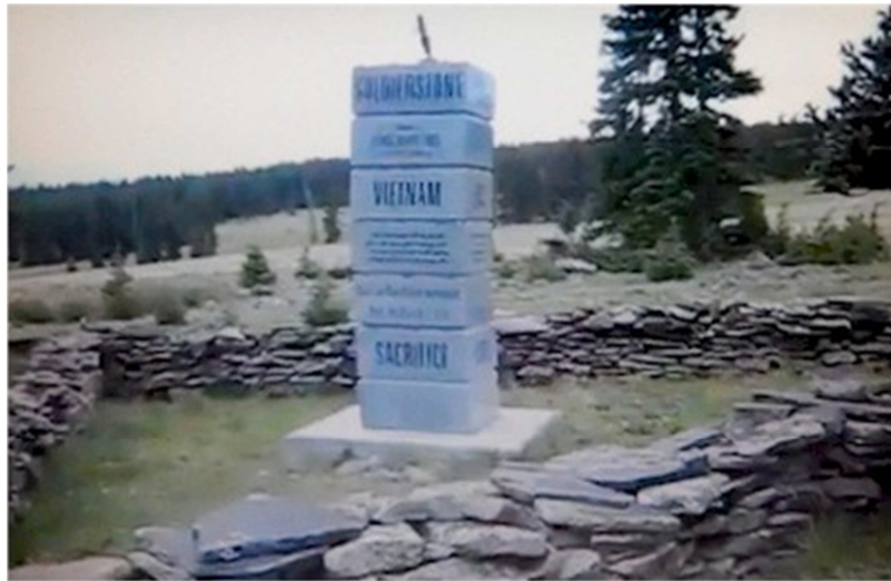
Bia đá kỷ niệm Chiến Tranh Việt Nam trên đồi núi Colorado.