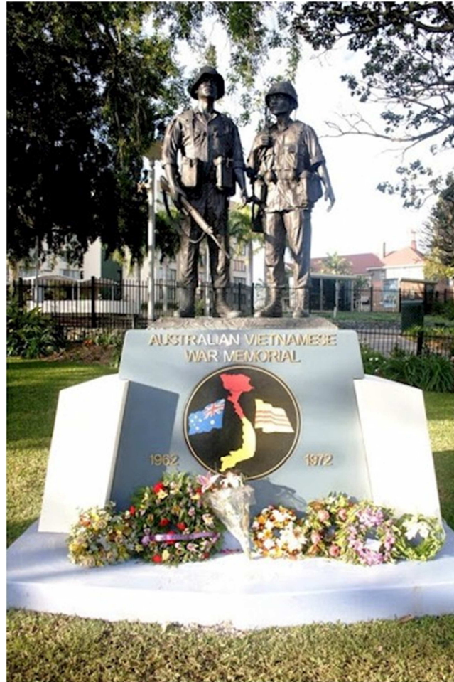
Tượng Đài Chiến Sĩ Úc-Việt, Brisbane, Australia

M ời xem một số hình ảnh Tượng đài ở các nơi khác mà các thân hữu đã chuyển cho tôi xem qua Internet.