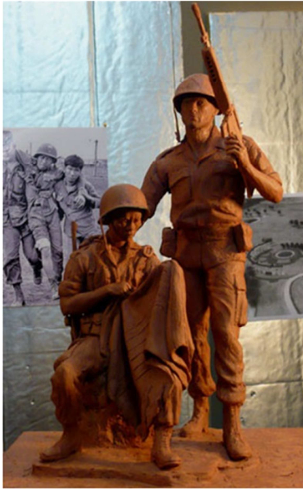
Tượng Đài Chiến Sĩ Việt-Mỹ, Arlington, Texas