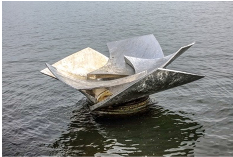
Tượng Đài Hoa Sen. (Tài liệu của CĐNV Na-uy)

Tượng Đài Thuyền Nhân tại Bảo Tàng Viện Hàng Hải Oslo, Na-uy.