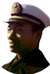
Tất Ngu - Người về từ Hoàng Sa