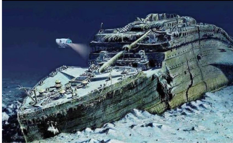
Xác con tàu Titanic dưới đáy đại dương