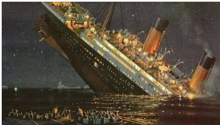
Tàu Titanic đang chìm xuống biển

Con Tàu Titanic Phân tài liệu của Hoàng Nguyên Vũ