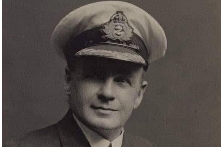
Charles Lightoller, Thuyền phó thứ 2 của tàu Titanic

Thuyền phó tàu Titanic tiết lộ bí mật vĩ đại giấu kín nửa đời người, phương Tây họ vẫn minh hơn chúng ta từ rất lâu!